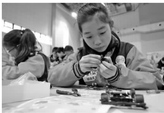
选手在组装轨道车。

据悉,该剧首演之后,剧组还会根据专家意见进行修改,为接下来进校园演出做充分准备。