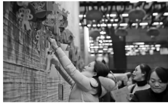
市民在博物馆里猜灯谜。

今日,由宁波市文化广电新闻出版局主办,宁波逸夫剧院承办的“传梨园梅韵 赏百家流芳——2018宁波逸夫剧院中国戏曲展演季”将由梅花奖得主、秦腔名家齐爱云和张涛主演的《焚香记》拉开帷幕。此外,越剧、京剧、淮剧、沪剧、杭剧等也将陆续上演。