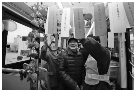
市公交公司组织开展的车厢灯谜活动。

展厅的另一边,是越剧现场演出。演出还未开始,台下就坐满了热爱越剧的观众。开场后,国家二级演员徐秋霞与全国越剧演唱大赛银奖得主胡央青等五位越剧表演专业老师携越剧业余爱好者为观众们现场演唱《观灯》《十八相送》《我家有个小九妹》等越剧经典唱段。表演结束后,老师还邀请现场观众,手把手进行现场越剧交流和教学。