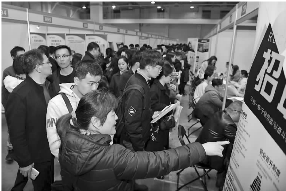
人头攒动的招聘会现场。

昨天,宁波人才市场首场春季大型招聘会在宁波国际会展中心7号馆举行。作为我市春季最大规模的招聘活动,本场共吸引了方太厨具、得力集团、海天塑机、金田铜业、申洲针织、中银(宁波)电池、上海大众汽车宁波分公司等900余家单位参加。