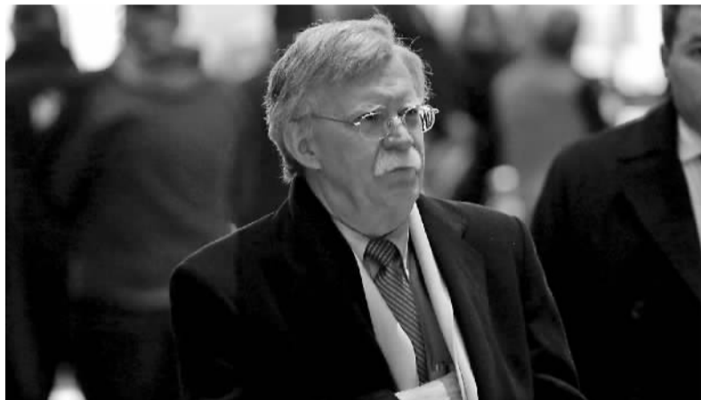
这是2018年3月16日在美国华盛顿白宫拍摄的总统国家安全事务助理麦克马斯特的资料照片。