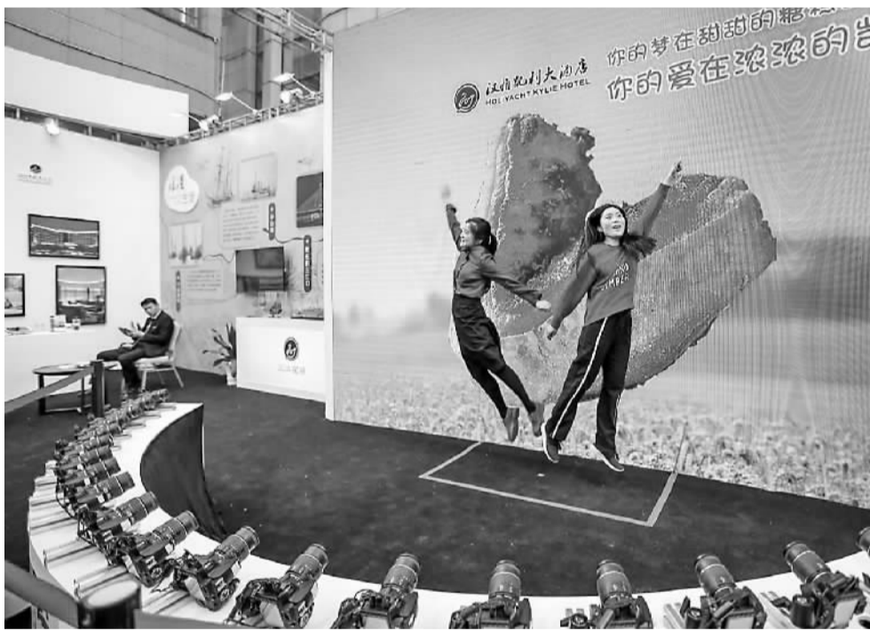
市民在体验“子弹时间”的拍摄。

本报讯(记者 谢舒奕 通讯员 陈瀚 刘绍雄 文/摄)除了香车美女,第29届宁波国际汽车博览会还有哪些看点?记者昨天发现,一款名为“子弹时间”的高科技拍摄系统引起许多逛展人士的关注,成为本届国际车博会的最大亮点之一。