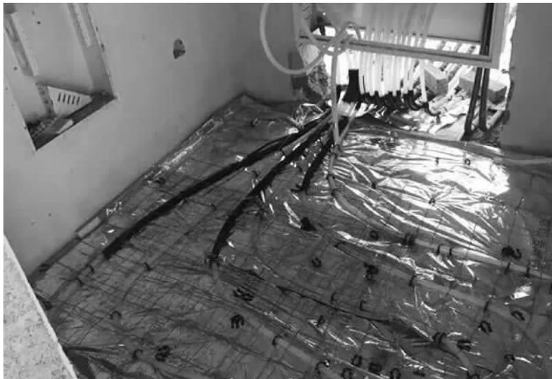
宁波府项目施工现场,地暖盘管布线时疏时密,极不规则。