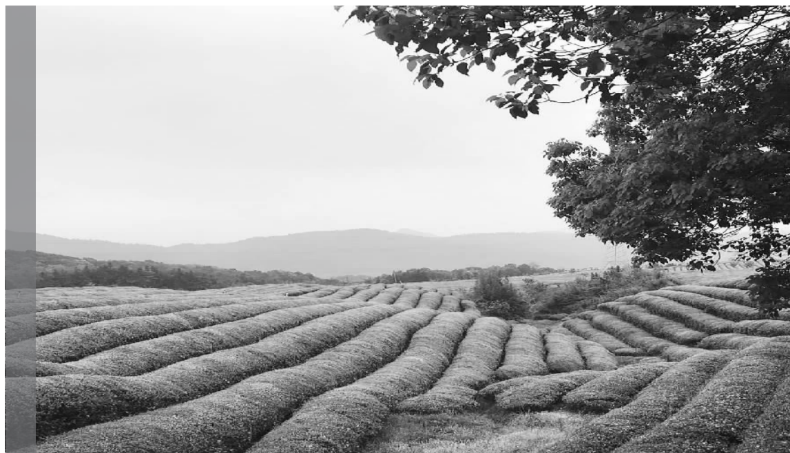
鄞江镇金陆村清修茶园。