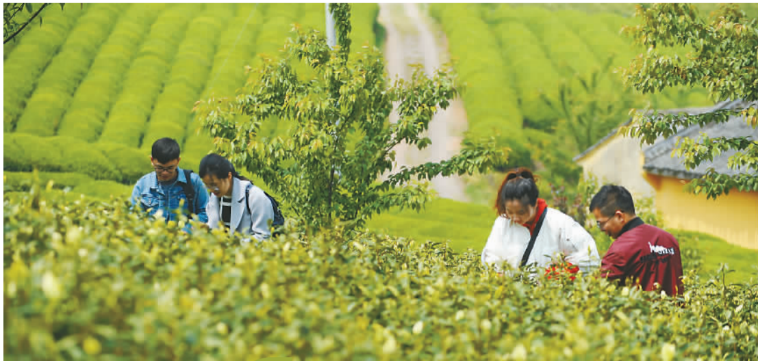
嘉宾们在清修茶园一起采茶。