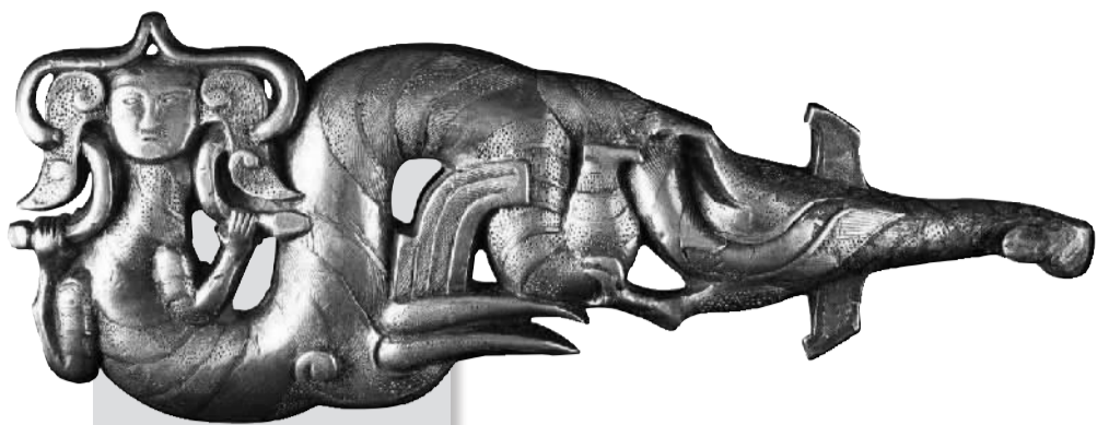
伏羲纯银贴金带钩