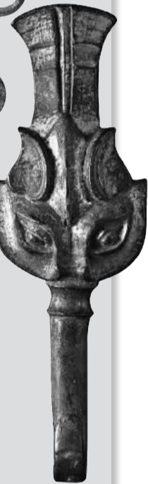
龙首鎏金镶嵌绿松石熊形青铜带钩