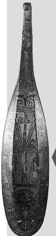
龙首错金银几何纹青铜带钩