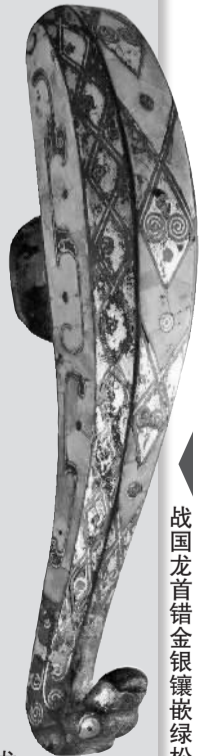
战国龙首错金银镶嵌绿松石凤鸟几何纹青铜带钩