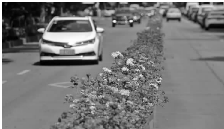
百丈东路上的月季花带。

本报讯(记者 边城雨 通讯员 朱琼)入春以来,宁波开启了“繁花似锦模式”,樱花、海棠、红叶李、杜鹃花……各种花朵在城市各个角落轮番次第开放,让人目不暇接。昨天,记者从市城管园林部门了解到,为进一步加快“绿盈名城,花漫名都”建设,切实提高城市绿地品位和档次,今年我市将着力打造“一路一花,一路一品”,计划建成多条特色花卉景观大道,打造城市多彩迎宾带。目前,我市中心城区多条主要道路正在推进以“月季”为主要观赏花卉的景观大道改造,如海曙的丽园北路、鄞州区的首南中路、江北区的大庆南路等。