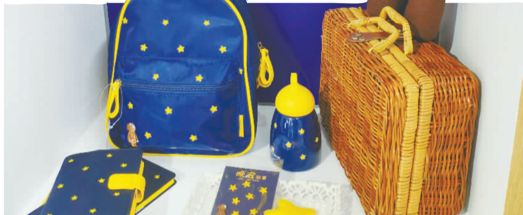
广博Kinbor的“晚安故事”系列。

从可爱的“晚安故事”系列小熊文具，到可以放在口袋里的打印机，再到火遍“抖音”的“网红产品”自动卷笔刀和桌面清洁器……昨天，这些新奇的小物件，在首届中国自主品牌博览会宁波馆的展台亮相时，吸引了不少观众的目光。“这东西真好玩，多少钱啊？我也想给孩子买一个……”这是记者在现场听到的最多的话。