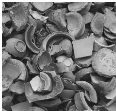
北宋陶质匣钵与精品青瓷