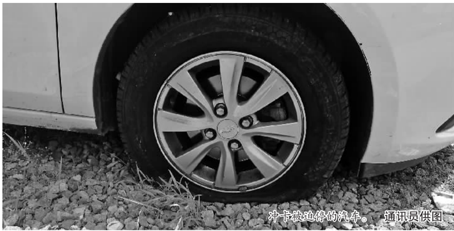
冲卡被追停的汽车。