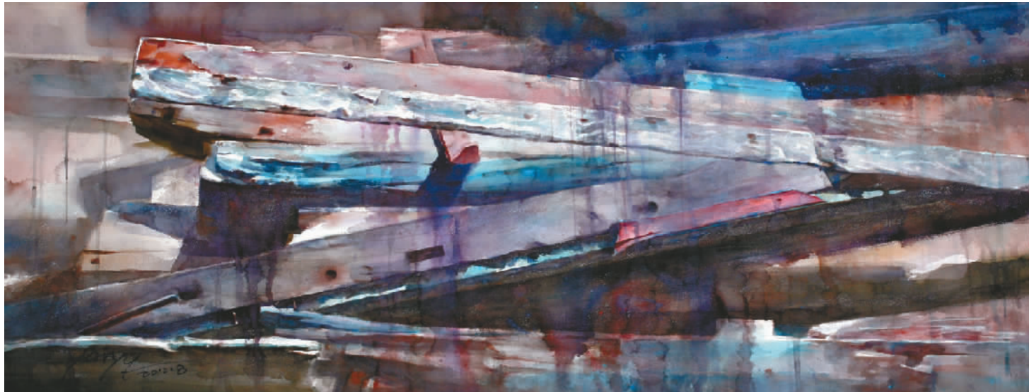
阎云泉作品《海迹·灼日》(水彩画)