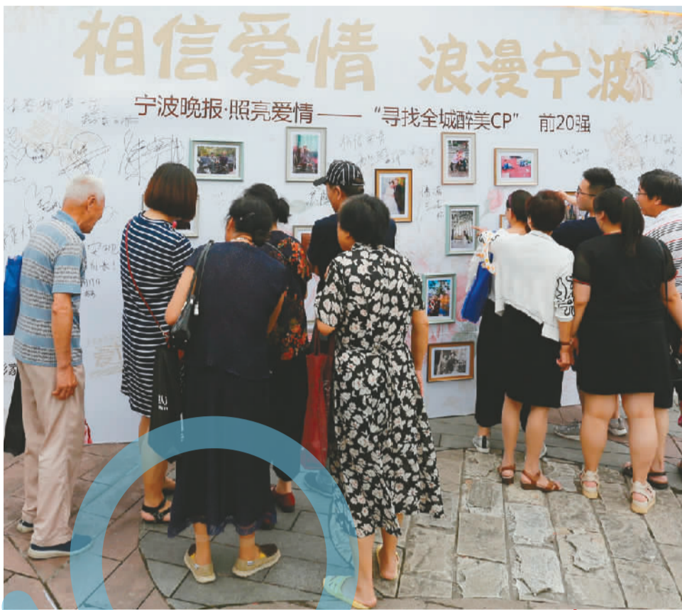
活动现场，市民围观“醉美CP照”。