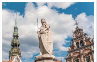
▲《里加——罗三雕像》展项作品