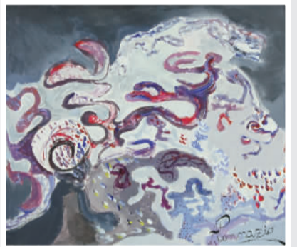
《小小油画家》展项作品