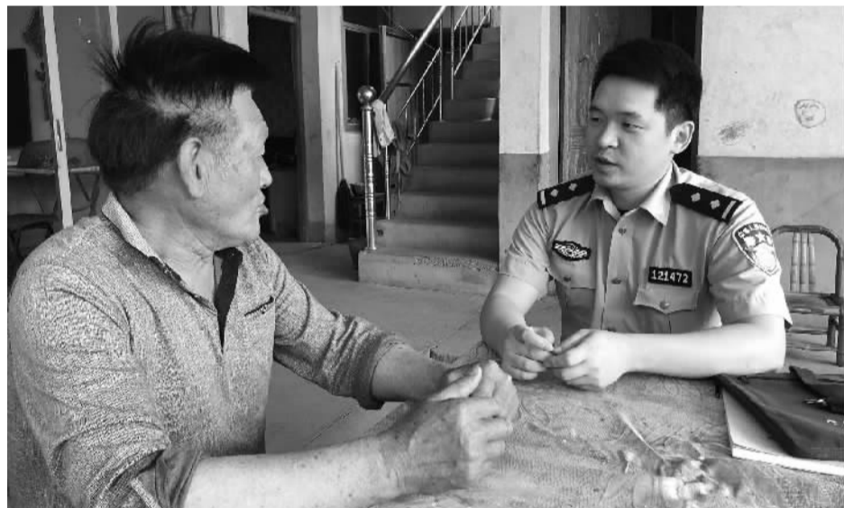
民警正在开展“家庭警务”走访工作。

全市公安机关开展“千警下基层、万警大巡访”专项行动以来，宁海县公安局岔路派出所坚持工作依靠群众、真心服务群众、一切为了群众原则，大力创新新时代社区警务，提出了“家庭警务”工作新模式。