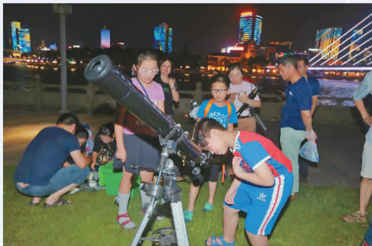
昨晚9点多,市民在杉杉公园通过天文望远镜观察红月亮。

昨夜今晨,“火星冲日”与月全食同时出现在甬城上空。昨晚,南塘老街对面鄞奉路路边的滨江公园二层平台和江东北路三江口杉杉公园平台这两个点,众多市民和天文爱好者聚集,通过天文望远镜观察奇妙天象。