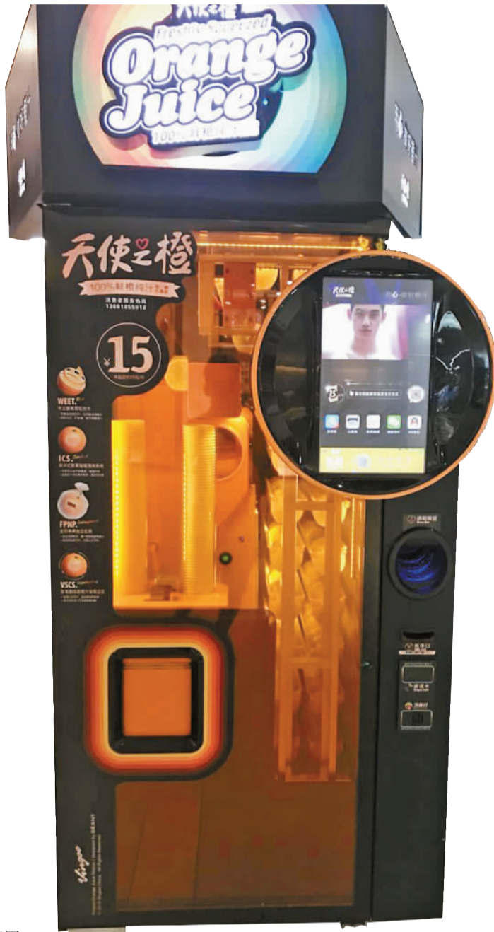
放置在利时城市奥特莱斯的自助鲜果榨汁机。

记者随后联系到了该鲜榨果汁机的提供商。据其上海总部工作人员介绍,目前这种自助式的鲜榨果汁机在宁波投放量并不大,总数应该在20台左右,而在中心城区只有鄞州万达、利时城市奥特莱斯、来福士广场和宁波书城有所布设,而且鄞州万达和来福士广场还都是放置在地下停车场。至于合作方式,对方表示目前有两种方式:一种是