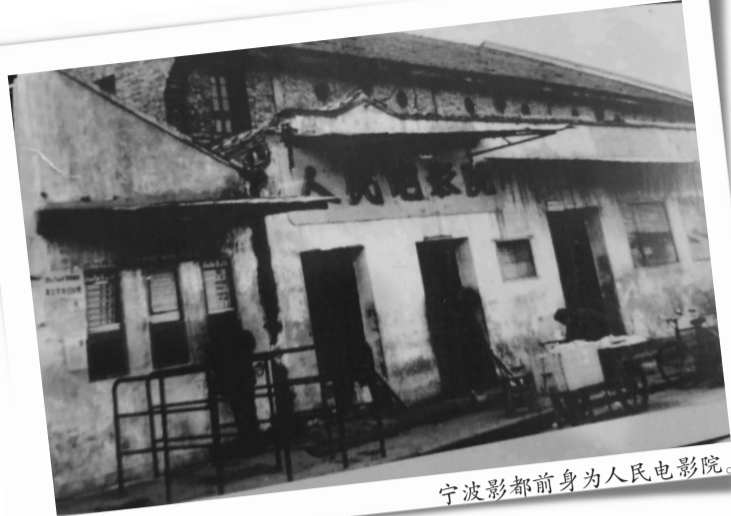
宁波影都前身为人民电影院。