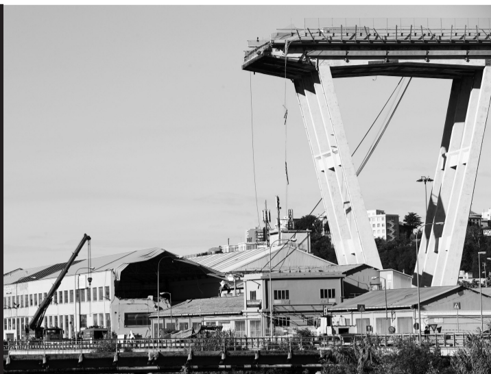
8月15日,在意大利热那亚公路桥垮塌现场,救援机械在现场工作。

桥龄过半百的莫兰迪桥前一天垮塌,至少39人遇难,救援人员连夜搜救幸存者。事故原因可能包括桥体老化、缺乏维护。政府官员说,已启动调查,包括桥梁在内的全国基础设施亟待仔细检查。