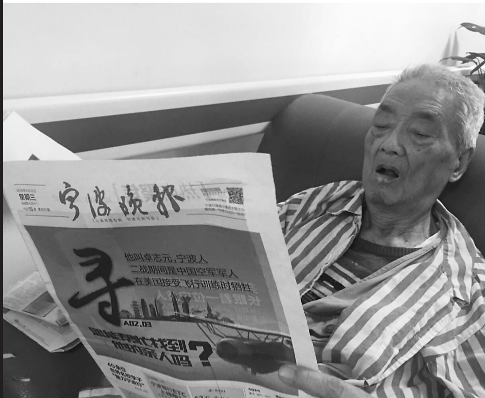
卓志伟老人仔细阅读本报关于他三哥的报道。