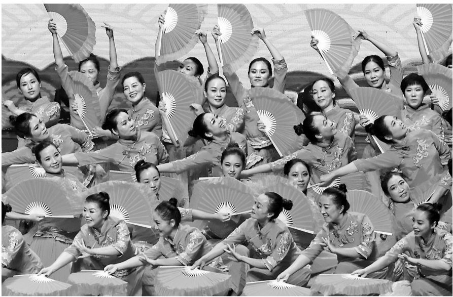
广场舞决赛现场。

本报讯(记者 俞素梅) 作为2018“一人一艺杯”宁波市首届舞王大赛的系列赛事之一,宁波市广场舞展演活动(决赛)昨晚在文化广场大剧院举行,海曙区洞桥镇舞蹈队和慈溪市文化馆舞蹈队从30支参赛队伍中脱颖而出,夺得了本次决赛的前两名,他们也直接进入了宁波市首届舞王大赛半决赛,将争夺首届宁波舞王“十强”头衔。