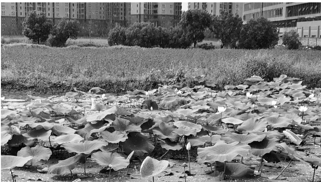
马鞭草与荷花相互映衬。

本报讯(记者 边城雨 通讯员 朱娇文/摄) 50余万株柳叶马鞭草花期正盛,放眼望去,一大片紫色花海在风中摇曳,别有浪漫风情。虽然不是节假日,还是吸引了不少市民赏花,这是记者昨天在位于鄞州区下应街道的洋江花海看到的一幕。