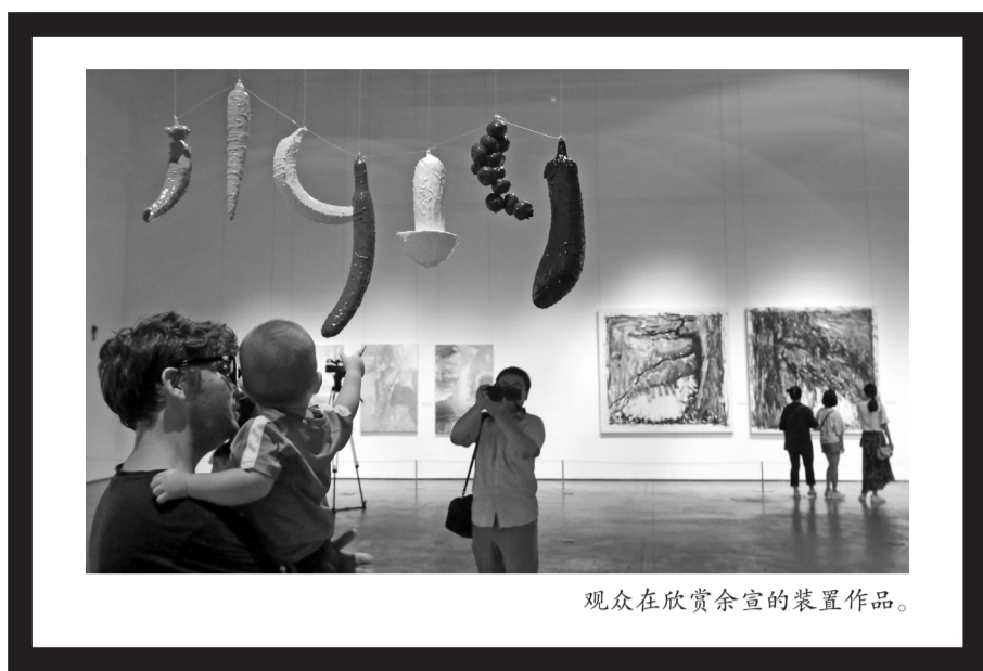
观众在欣赏余宣的装置作品。