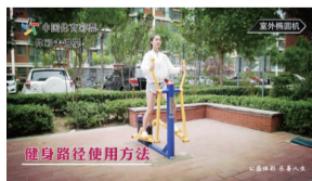
《体彩大讲堂—健身路径》