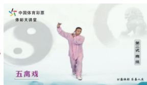
《体彩大讲堂—五禽戏》