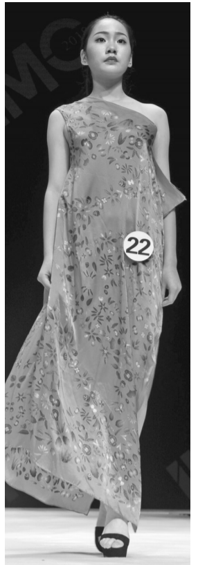
参加决赛的部分模特。