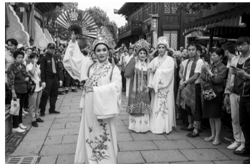
往年象山影视城影视嘉年华盛况。

本报讯(记者 庞锦燕 通讯员 吴宙洋 文/摄) 国庆七天怎么玩?去象山影视城是个不错的选择。记者昨天获悉,象山影视城十一影视嘉年华将于10月1日启幕。至于嘉年华的重头戏——明星见面会,本报记者也提前打探清楚了。据工作人员透露,《鹤唳华亭》《新神雕侠侣》《大周小冰人》三大剧组届时将与粉丝面对面互动,快排好时间与偶像偶遇吧。