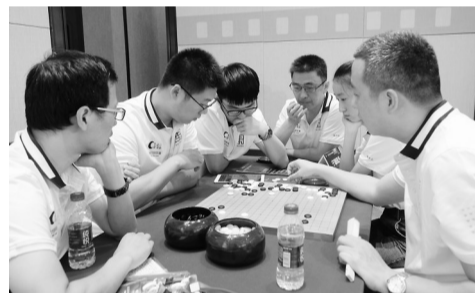
宁波疏浅队在比赛中。记者 胡龙召 摄

本报讯(记者 戴斌 通讯员 忻志华)昨天,2018赛季城市围棋联赛八强战中,宁波疏浅队在北仑主场设擂迎战柳州文旅队,最终在三盘两胜的较量中以2:0结束战斗,晋级四强。