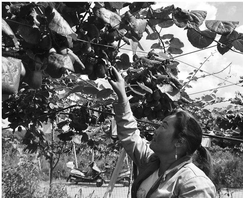
贵州兴仁县的红心猕猴桃标准园区内，村民正在采摘猕猴桃。

要想帮助贫困地区彻底脱贫、持续脱贫，产业的带动和支撑是关键。近年来，宁波对口帮扶工作组和企业发挥自身优势，创新扶贫思路，通过产业扶贫、项目扶贫，变“输血”为“造血”，为对口帮扶地区的精准扶贫添加持续动力。