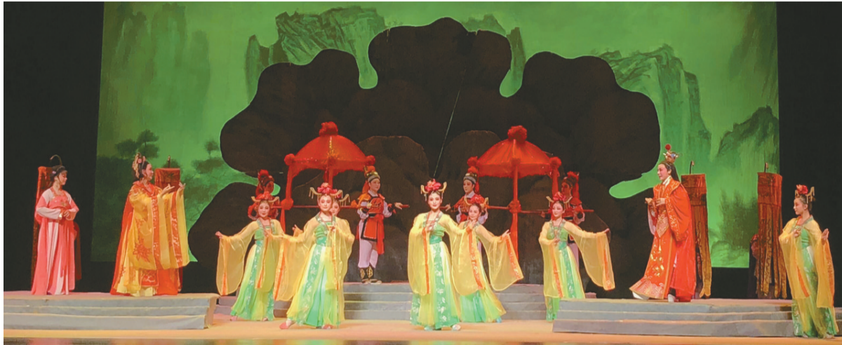
新编越剧《荣华梦》昨晚在清华大学演出。

本报讯(记者 陈晓旻 通讯员 房炜 文/摄)“公主,我的妻……”第四幕当董文伯出场时,这一句徐派韵味十足的清板“叫头”唱法起声,低八度一口气飙高了八度,高难度的唱法不仅把人物内心的情感推到了顶点,也把剧情推向了高潮,场下爆发经久不息的掌声。