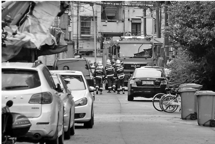
消防车被停放在消防通道上的私家车拦住去路。

消防通道是消防人员实施营救和被困人员疏散的通道。当火灾发生时,消防通道是逃生和救援的“生命通道”,具有极其重要的作用。