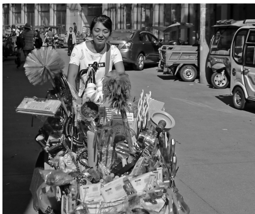
一辆手推车是她一天的营生。(资料图片)