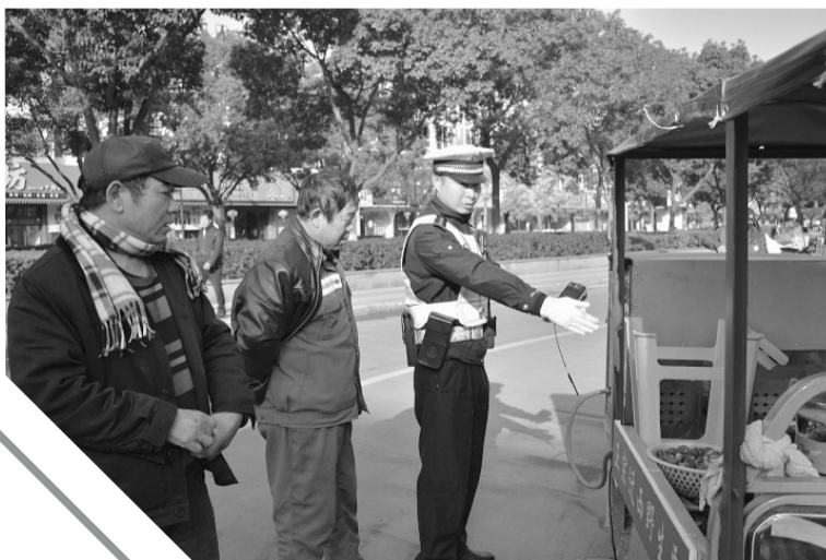
励勇在执勤。