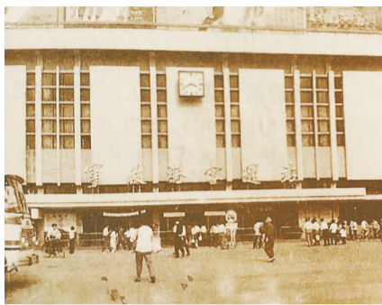
上世纪80年代的江北轮船码头。据宁波交通志