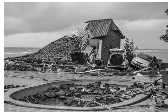
12月23日,在印度尼西亚万丹省卡里塔,海啸过后一片狼藉。

黄树贤说,草案将村民委员会、居民委员会的任期由3年改为5年,与村和社区党的委员会、总支部委员会、支部委员会的任期保持一致,有利于坚持和加强党的全面领导,完善党领导下的基层群众自治制度和工作机制,促进村和社区公共事业健康有序发展,有利于实现村民委员会、居民委员会换届工作与村和社区党组织换届工作统一部署、统一实施,有利于保持基层群众自治组织负责人队伍相对稳定。