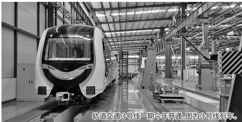
轨道交通3号线一期今年开通,图为3号线列车。

2019年,宁波人在交通出行方面有哪些变化值得期待?这些变化,又会对我们的生活带来怎样的影响?新的一年,又有哪些出行新选择值得宁波市民期待呢?