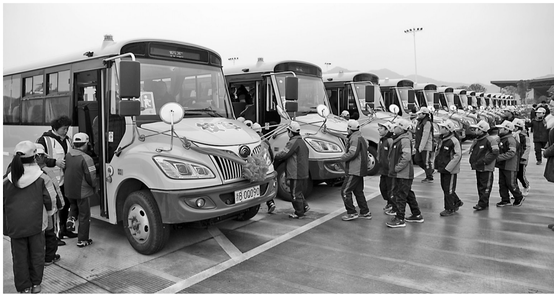
同学们排队上车。

运营和维护。为了把好驾驶员关,象山县城乡公交公司依照家庭背景、年龄、身体状况、习惯嗜好等方面条件,严格挑选驾驶员并完成上岗培训。此外,每辆校车还配备一名随车照管人员,负责每个站点学生点名 and 秩序维护工作。一旦有学生缺席,照管人员会第一时间与家长联络,与学校做好对接登记工作。