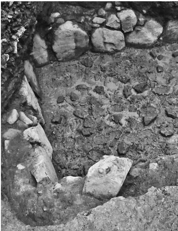
上图:鄞县故城内的石砌水池与烧灰面(局部)。