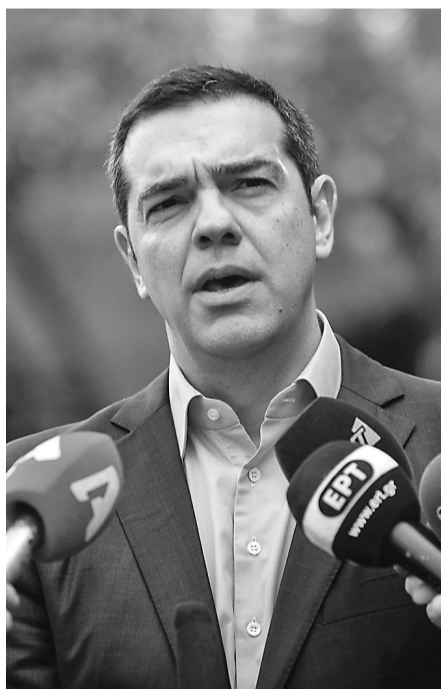
1月13日，在希腊雅典，希腊总理齐普拉斯对媒体讲话。

齐普拉斯发表声明说，接受坎梅诺斯的辞职，并要求议会对他领导的政府举行信任投票，议会预期几天后投票表决。