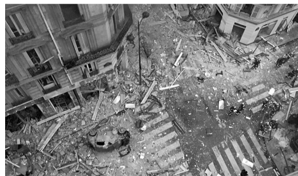
1月12日在法国巴黎拍摄的爆炸现场的残骸。