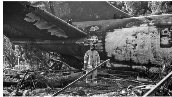
1月14日，在德黑兰附近，救援人员在坠机现场工作。