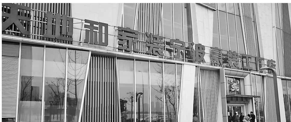
昨天不少客户到天地和了解情况,但吃了闭门羹。