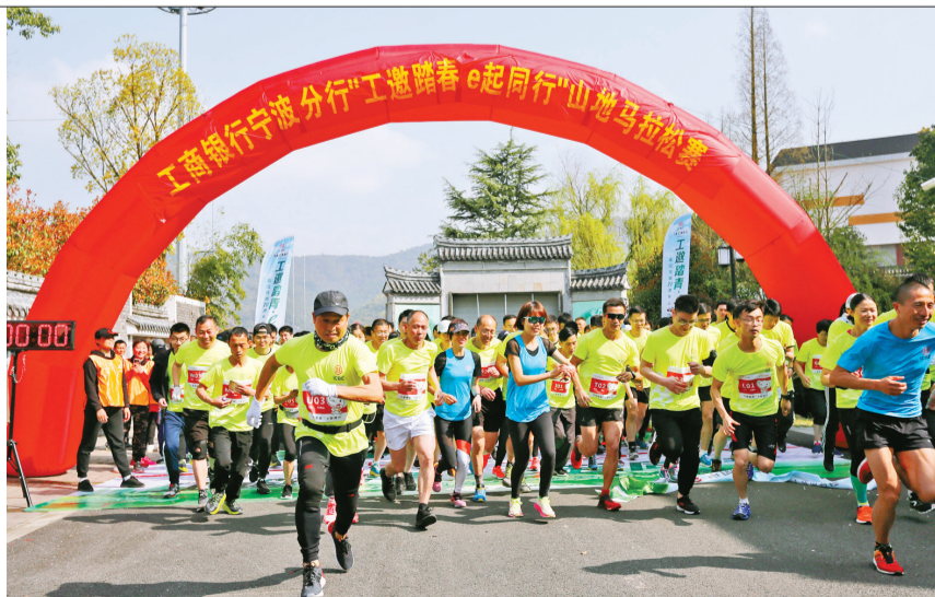
3月30日,工行宁波市分行“工邀踏青,e起同行”山地马拉松赛现场。

的业余生活,又能增强团队凝聚力与向心力,是一项十分有意义的活动。马拉松运动彰显的挑战自我、超越极限、勇往直前、永不放弃的体育精神也十分契合工行价值卓越、坚守本源、客户首选、创新领跑、安全稳健、以人为本的企业愿景。该行人士还表示,要将锲而不舍、顽强拼搏的体育精神带到日常工作中,为宁波发展贡献自己的力量。 崔凌琳 徐文蕾/文