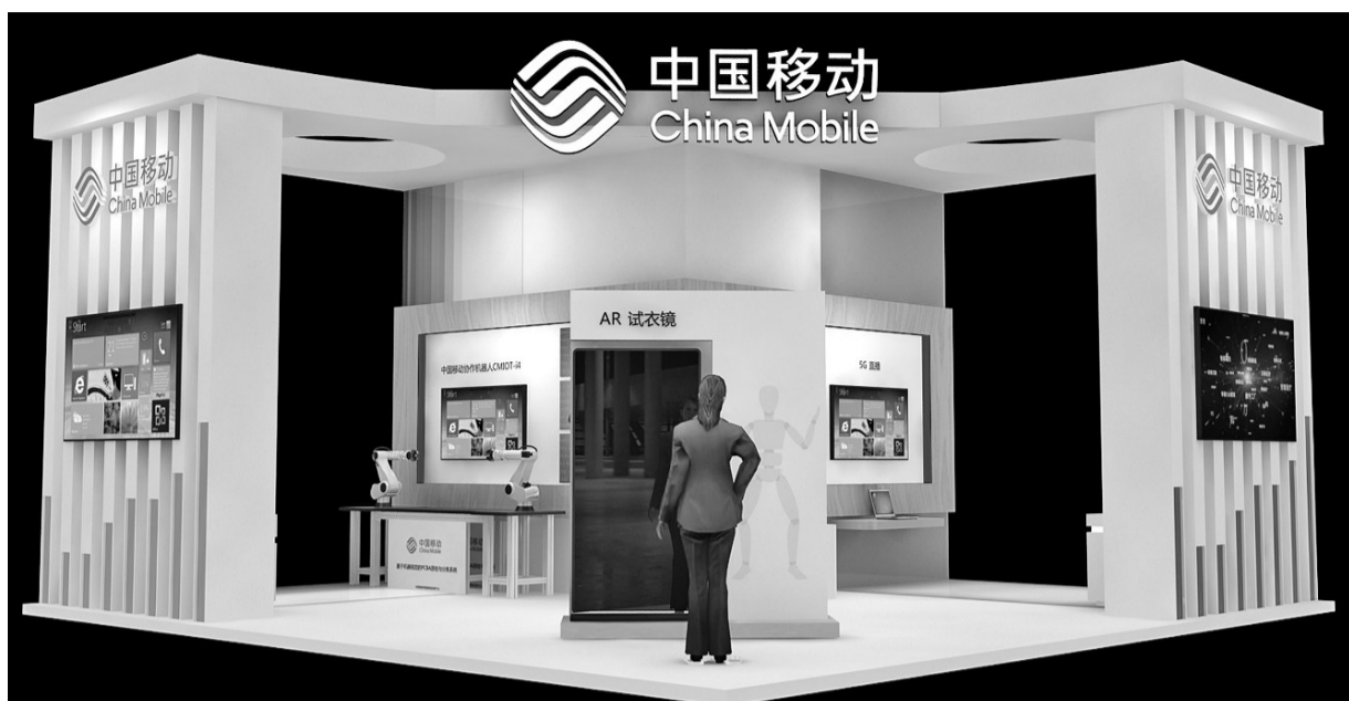
中国移动5G技术展位效果图。