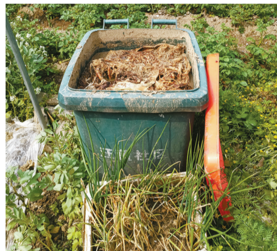
塑料垃圾桶成了臭气熏天的露天“粪缸”。

主办单位: 宁波日报报业集团、宁波市科学技术协会 宁波市住房和城乡建设局、宁波市自然资源和规划局 承办单位: 宁波晚报 现代金报 东南商报