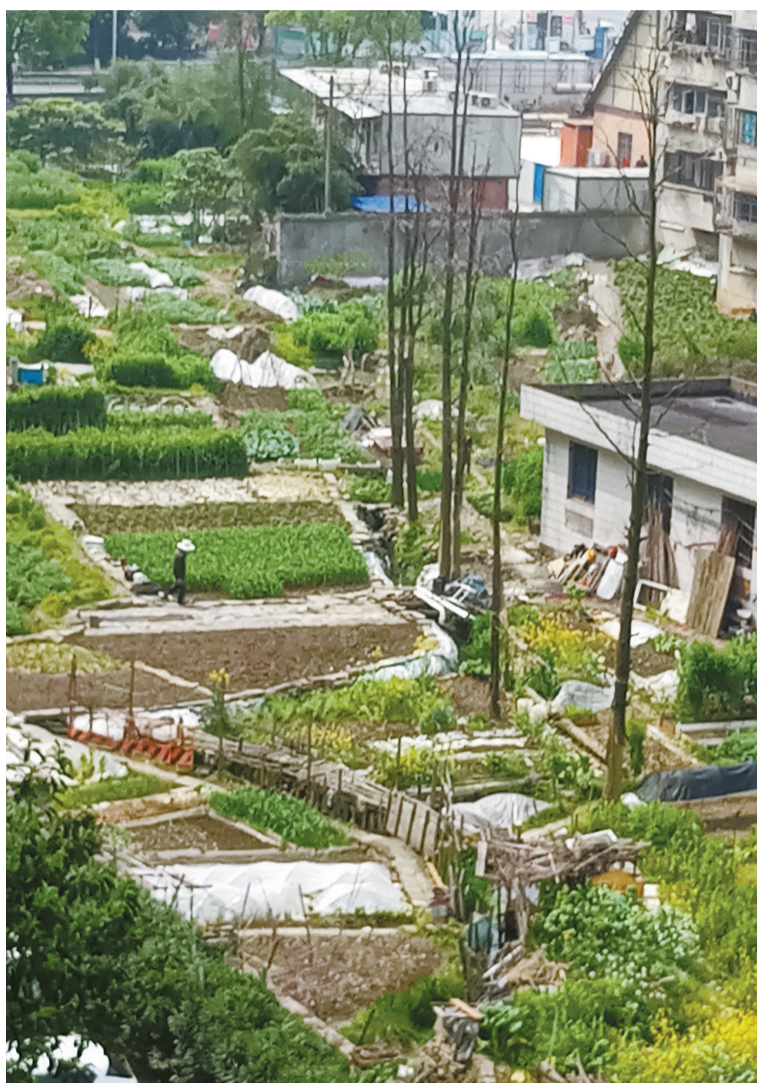
两小区之间的闲置地块成为菜园。