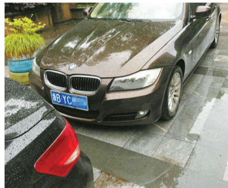
“李鬼”与“李逵”一前一后停放着。