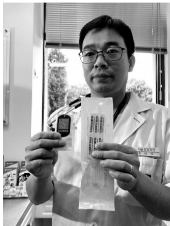
芯片虽小,信息量可不小。

APP“芯爱”(联动的宠物医院内都有相应软件下载二维码),按照软件上的信息指引,填写相关的基础信息,然后预约前往就近的宠物医院办理登记。这样提前做好信息登记和办理预约,整个流程将更加快速完成。