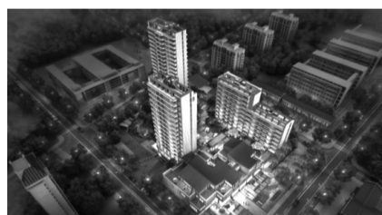
美的·鼓楼前项目效果图