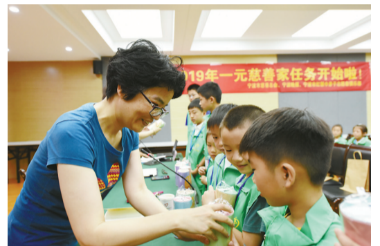
给参与活动的孩子分发任务和爱心储蓄罐。

本报讯(记者 徐叶 通讯员 侯金辉 文/摄)从暑期开始,利用6个月的闲暇时间“打卡闯关”做公益。2019年宁波市“一元慈善家”活动于15天前向全市小朋友广发“召集令”,邀请5-15岁少年儿童热情参与。