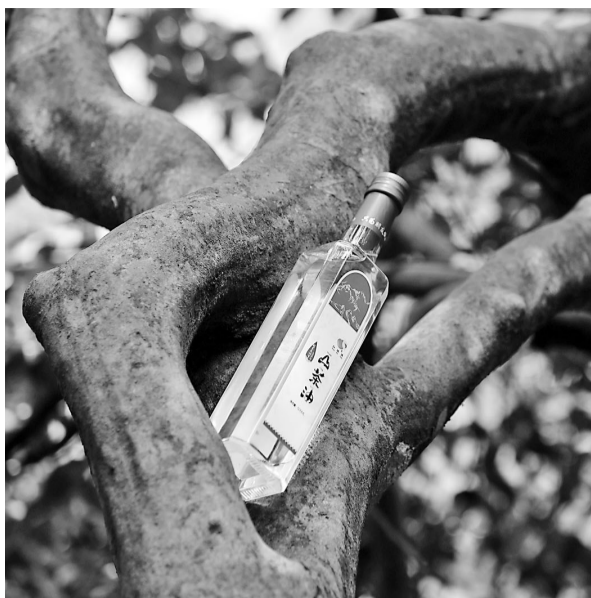
册亨县弼佑镇,清澈的山茶油和千年山茶树相映成趣。