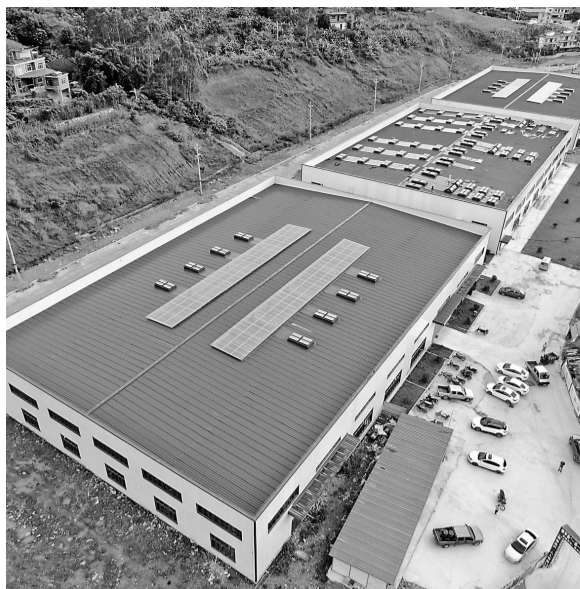
位于巧马镇山坳里的天香布依油茶有限公司新厂房。