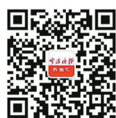
《宁波晚报》养生汇公众号