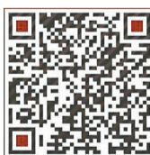
《宁波晚报》养生汇小药神客服号