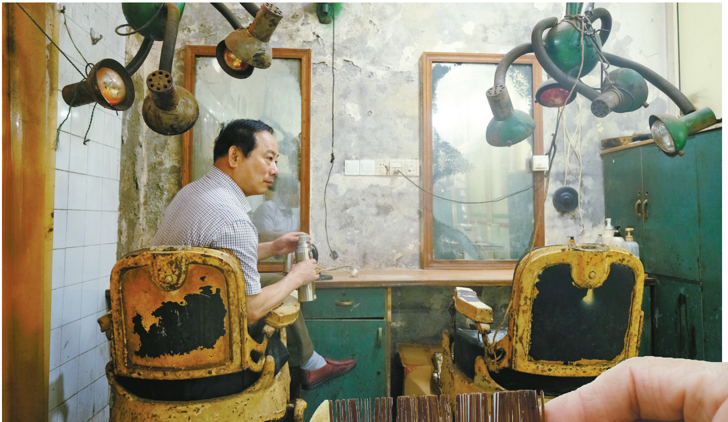
斑驳的墙面烙上了岁月的痕迹