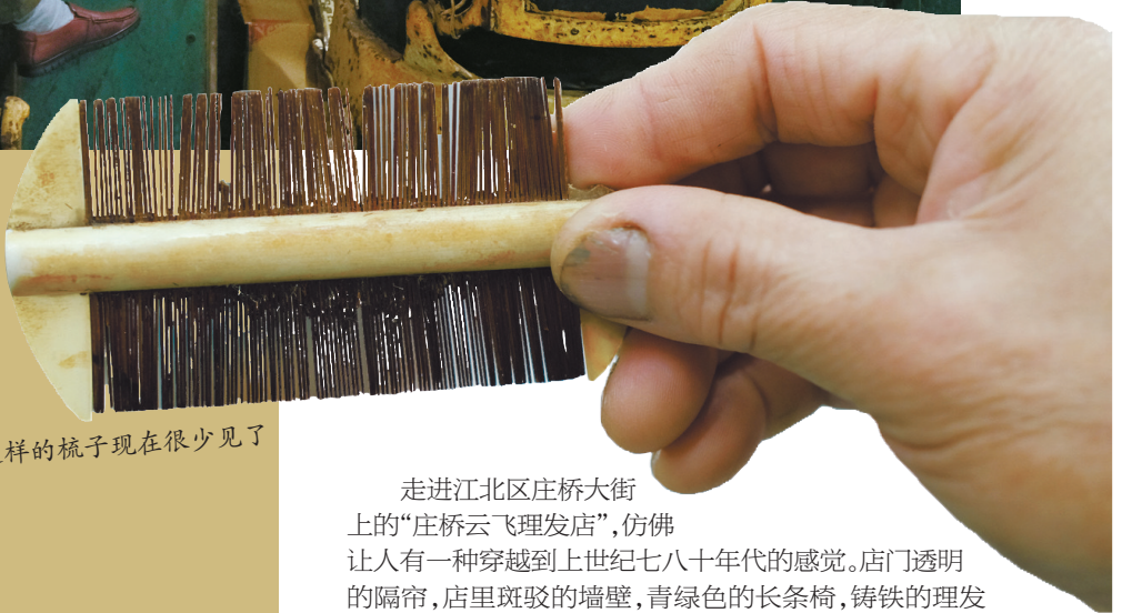
这样的梳子现在很少见了